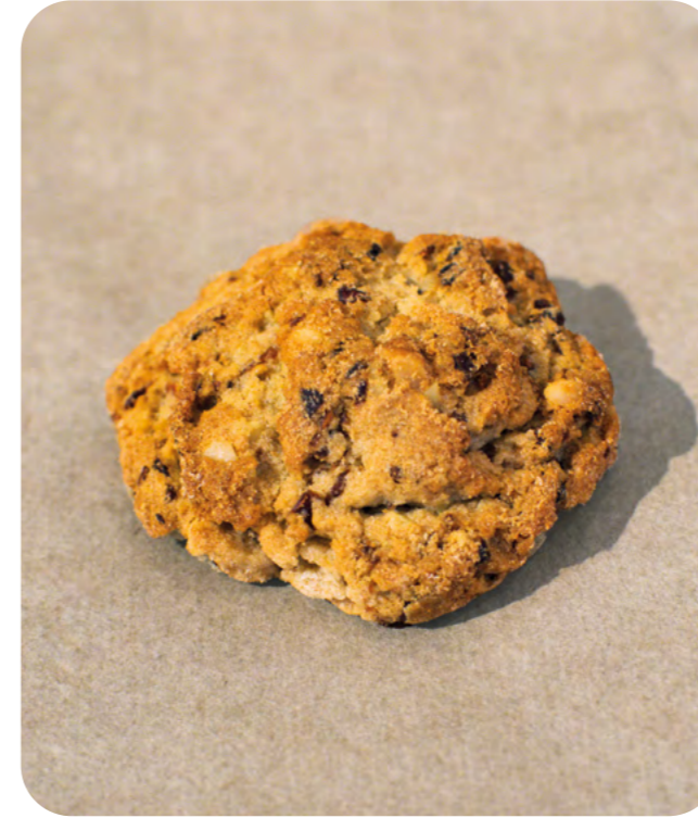
GALLETA DE TRIGO SARRACENO, ZANAHORIA Y ALMENDRA BIO