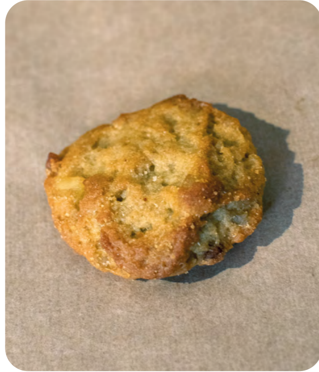
GALLETAS VEGANAS DE KHORASAN, LIMÓN CARAMELIZADO, JENGIBRE Y MELAZA BIO