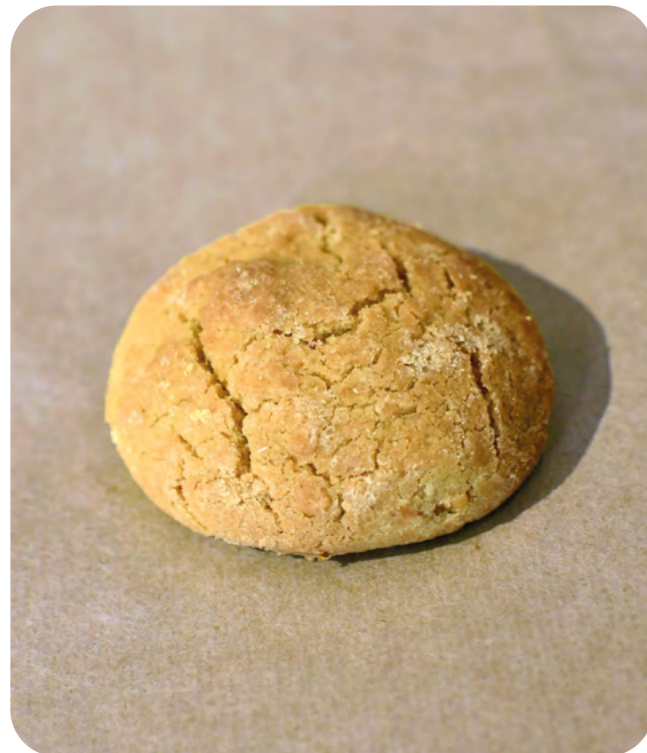
GALLETAS DE ESPELTA Y CÚRCUMA BIO