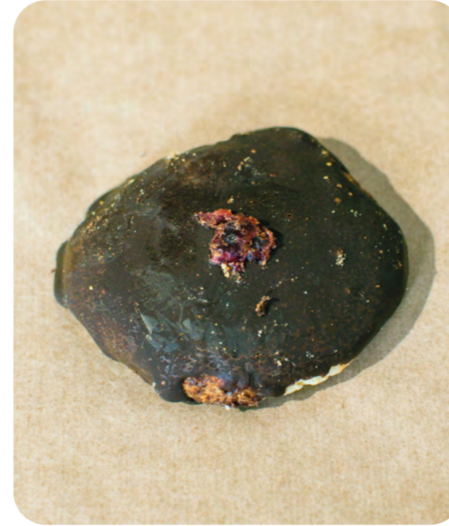
GALLETAS DE ESPELTA RECUBIERTAS CON CHOCOLATE Y ARÁNDANOS BIO