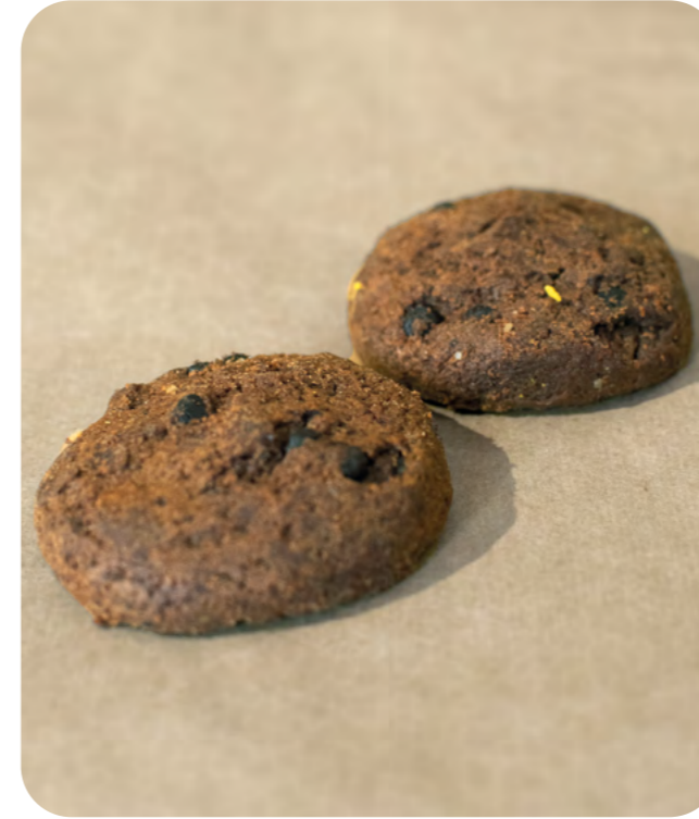
GALLETAS DE ESPELTA Y CACO CON EDULCORANTE BIO