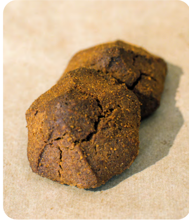
GALLETAS VEGANAS DE TRIGO SARRACENO, MELAZA Y ALGARROBA BIO