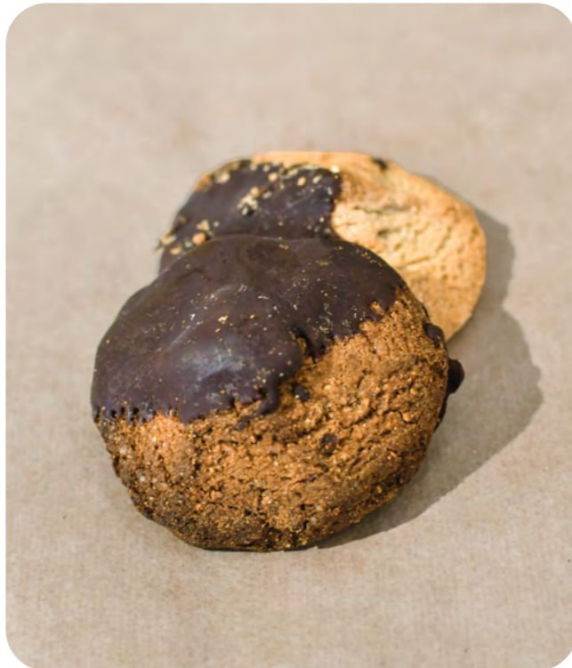
GALLETAS DE CASTAÑA RECUBIERTAS DE CHOCOLATE BIO