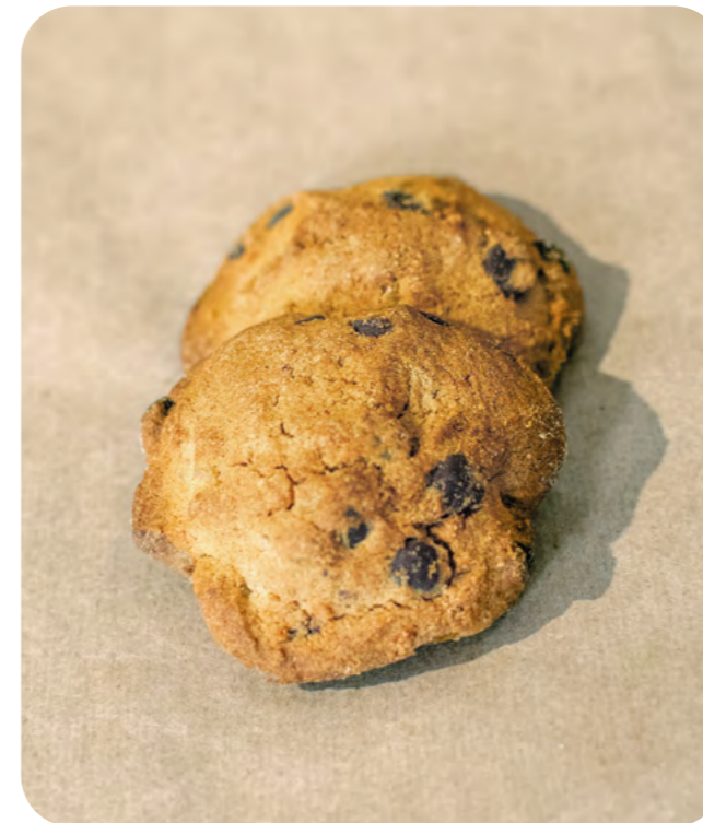
GALLETA DE TRIGO SARRACENO, NARANJA Y CHOCOLATE BIO