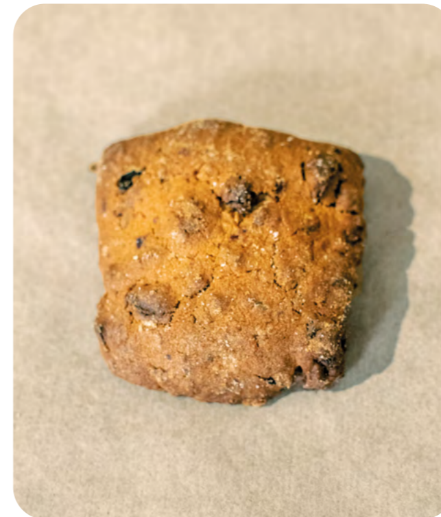
GALLETAS DE ESPELTA, ARÁNDANOS Y MANZANA BIO