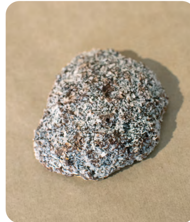
GALLETAS DE ESPELTA RECUBIERTAS CON CHOCOLATE Y COCO BIO