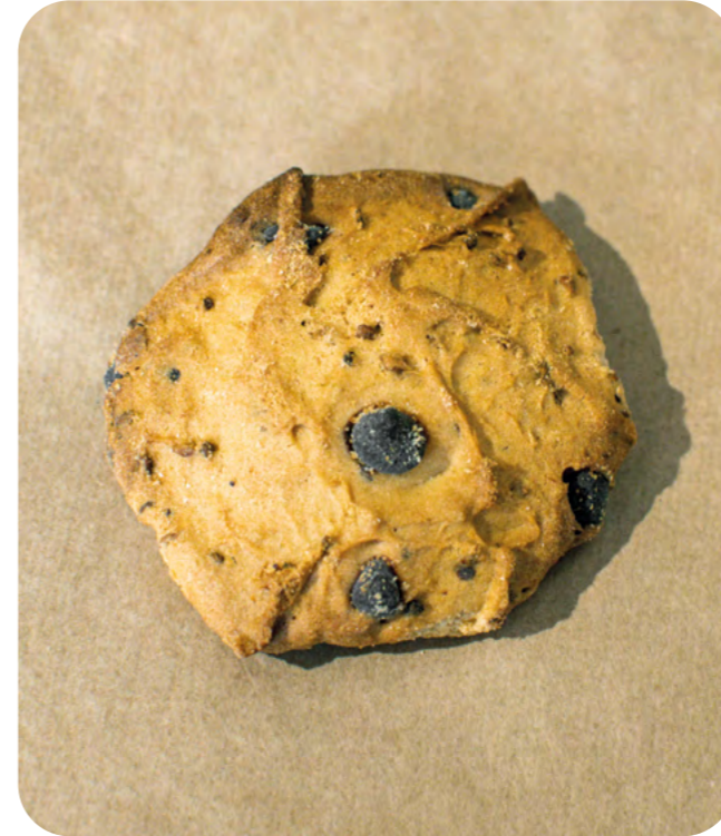
GALLETAS VEGANAS DE ESPELTA CHOCOLATE Y ANÍS BIO