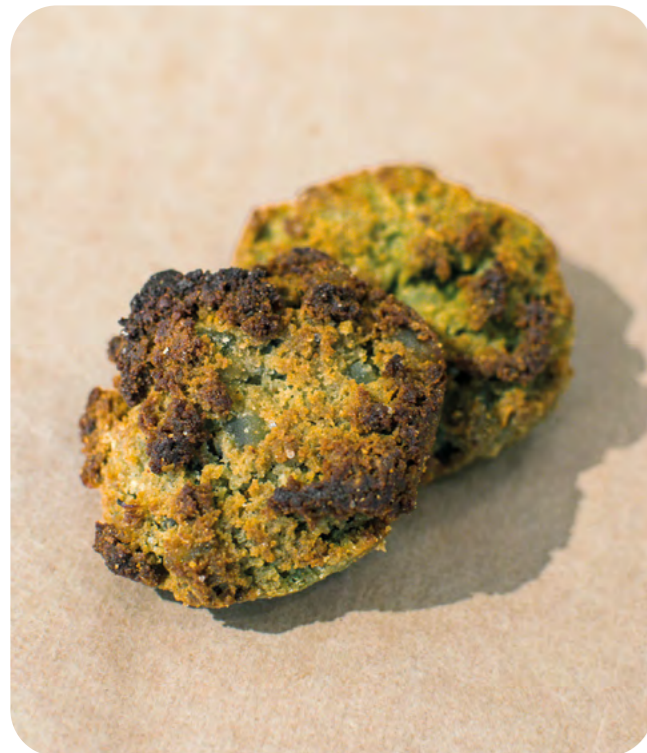
GALLETAS DE ALMENDRA CON COCO, LIMÓN, JENGIBRE Y TÉ MACHA