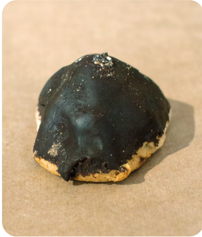
GALLETAS DE TRIGO SARRACENO CON PISTACHO RECUBIERTAS DE CHOCOLATE BIO