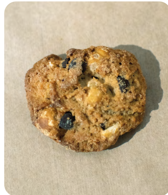
GALLETAS DE KHORASAN, AVELLANAS Y CHOCOLATE BIO